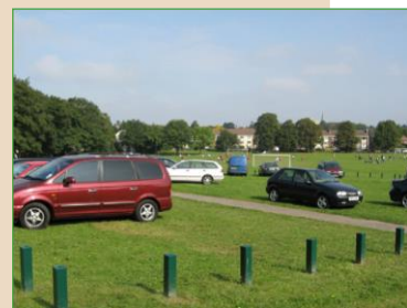
Na de plaatsing